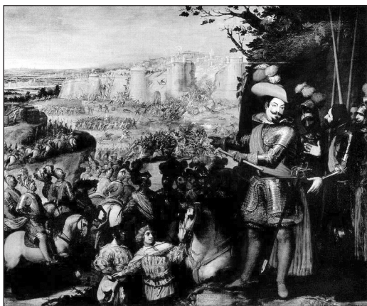
9. Vicente Carducho, 1634. La expugnación de Rheinfelden , 297 x 357. CAT P637.

imponerse por la fuerza y que debe actuar con disimulo y astucia. La técnica política se emparenta así con la técnica moral que deja de ser esfera de principios y creencias a imponer, para constituirse como ámbito del conflicto de intereses y de la negociación.