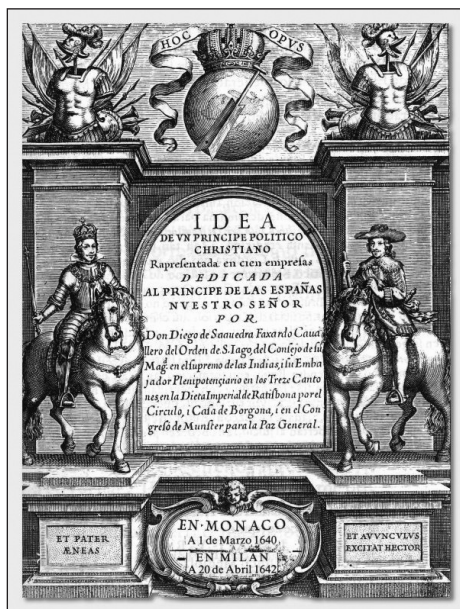
5. Saavedra Fajardo, Empresas políticas , Frontispicio.

superior inescrutable. La superposición de estos dos símbolos, esfera y pala, aparece también en la que pudiera ser una de las fuentes en que se inspiró el grabado de la portada de las Empresas . Se trata del grabado de Cornelis Galle para la edición de la obra completa de Lipsio en 1614, una obra que muy probablemente conoció Saavedra. Es en la figura femenina que representa a la política donde encontramos éstos símbolos que son aquí sus atributos definitorios. Con ello, la política misma se define como la habilidad en la dirección de la nave del estado 17 .